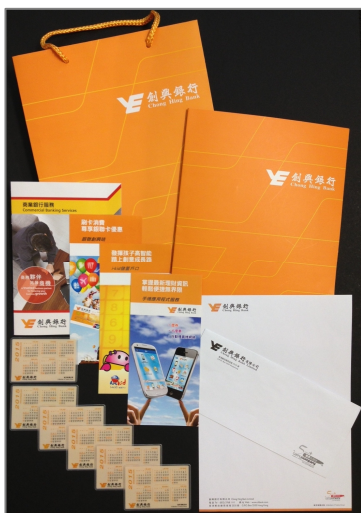
創興銀行各式宣傳物品及企業用品已換上新標誌。

創興銀行由即日起全面使用新標誌，該行分行網點、網站、網上銀行、流動理財服務、各式宣傳物品及所有企業用品等已換上新標誌；該行更推出以「新標誌・新力量」的企業形象廣告：以越秀集團廣州國際金融中心及香港創興銀行中心作為背景，加上閃爍的越秀集團品牌印記在星空中照耀，寓意創興銀行在實力雄厚的越秀集團全面支持下，將繼續傳承悠久的優質品牌，並通過充分發揮地理優勢、股東優勢及專業服務優勢，全面提升跨境綜合金融服務能力，銳意成為一個建基香港、覆蓋廣州及國內其他地區、輻射亞太區、具競爭力的金融機構。