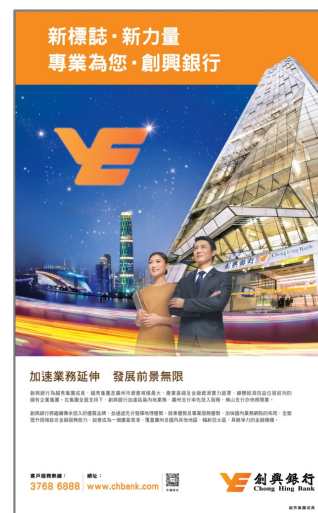
創興銀行全新的「新標誌・新力量」企業形象廣告。