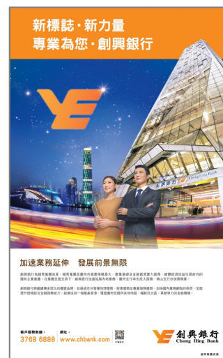
创兴银行全新的「新标志·新力量」企业形象广告。